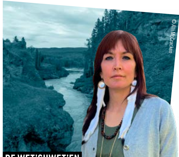
DE WET'SUWET'EN CANADA