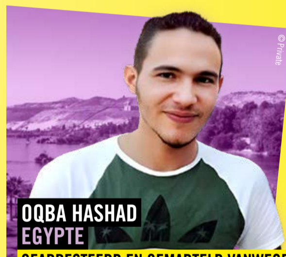
OQBA HASHAD EGYPTE

ONTVOERD EN OPGESLOTEN OMDAT ZE VERANDERING EISTE