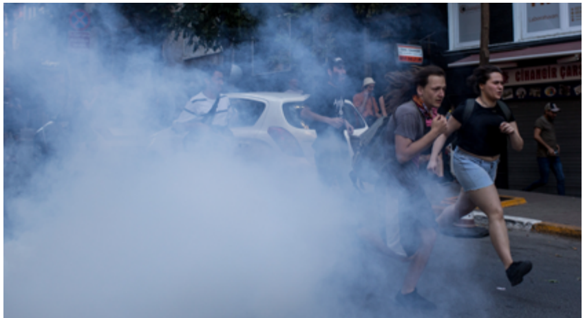
Simpatizantes del movimiento LGBT huyen del gas lacrimógeno disparado por la policía tras intentar marchar hacia la plaza Taksim.

Los funcionarios y funcionarias encargados de hacer cumplir la ley deben recibir formación de manera periódica y adecuada sobre todos los elementos de la lista supra y dominar el uso de las armas. Sólo deben recibir y utilizar sustancias químicas irritantes quienes hayan recibido la debida capacitación.