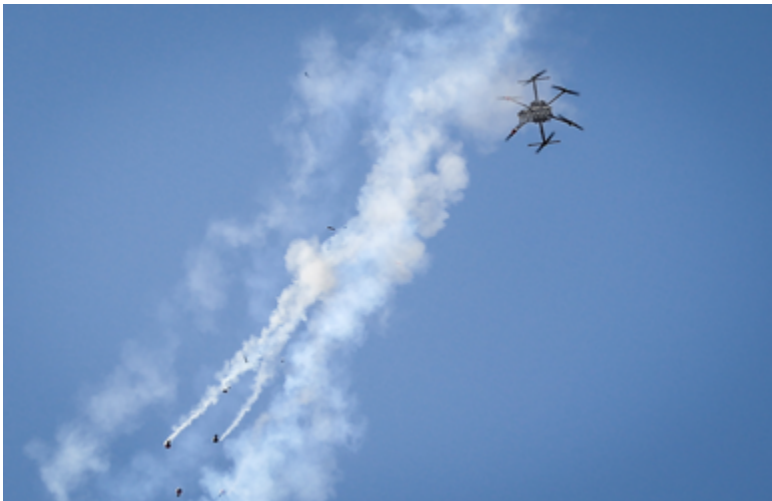
Un vehículo aéreo no tripulado perteneciente a las fuerzas israelíes lanza latas de gas lacrimógeno a los manifestantes palestinos durante una protesta

El riesgo de provocar pánico y una estampida debe evitarse mediante una valoración cuidadosa de la zona y la dirección probable que la gente podría seguir al tratar de escapar, así como de la cantidad de gas lacrimógeno empleado. Además, las autoridades deben dejar de utilizarlo de manera inmediata cuando se logra el objetivo y la gente comienza a dispersarse.