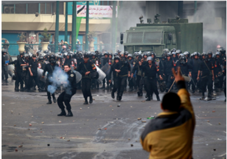
Un policía antidisturbios dispara gas lacrimógeno a los manifestantes frente a la mezquita de I-Istiqama en Giza, El Cairo, Egipto

El deber de reducir al mínimo los daños y lesiones 20 exige que las fuerzas de aplicación de la ley adopten diversas precauciones cuando recurran al uso de sustancias químicas irritantes. Las sustancias químicas irritantes, sin excepción, sólo deberían causar irritación. No deberían provocar lesiones por impacto físico, y deben utilizarse de un modo tal que se eviten ese tipo de lesiones.