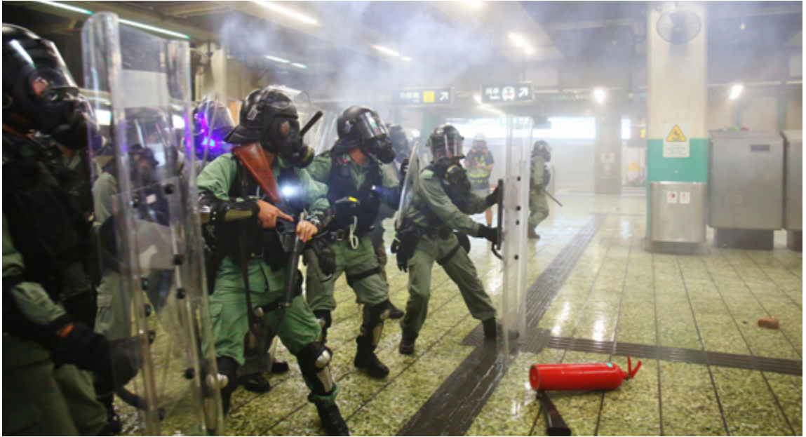
Gas lacrimógeno utilizado en una estación de metro de Hong Kong

Los funcionarios y funcionarias encargados de hacer cumplir la ley deben utilizar el gas de alcance amplio en estricta conformidad con su objetivo operativo de dispersar un grupo de personas que actúa con violencia. Por lo tanto, no debe utilizarse en espacios reducidos donde la gente no pueda dispersarse.