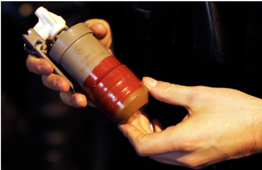
Un policía antidisturbios sostiene una granada GM2L durante una protesta antigubernamental en París.