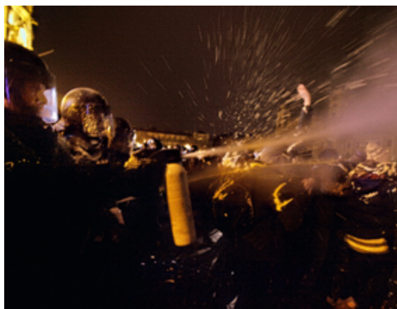
La policía antidisturbios rociaba con gas lacrimógeno a los manifestantes reunidos frente al edificio del Parlamento en Budapest

Los pequeños pulverizadores de mano están concebidos para usarlos contra una sola persona, mientras que los pulverizadores de corta distancia que tienen mucha presión y volumen (por ejemplo, los pulverizadores tipo mochila o con la capacidad de los extintores de incendios) pueden afectar a un grupo de personas. Estos últimos no deben utilizarse si sólo hay una persona que se comporta de forma violenta y las personas a su alrededor también podrían verse afectadas, ni de manera aleatoria contra una multitud y sin tener en cuenta quién comete o no actos de violencia.