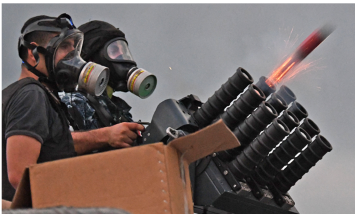
Fuerzas de seguridad libanesas disparan gases lacrimógenos contra los manifestantes en Beirut.

La cantidad de sustancia química irritante lanzada no debe superar el nivel necesario en cada circunstancia. Debe evitarse la exposición repetida o prolongada a agentes químicos irritantes, 25 lo que exige responder de manera gradual y lanzar al principio una cantidad pequeña. Con frecuencia se llenan calles enteras de grandes nubes de sustancias irritantes, que podrían propagarse a las viviendas y las calles adyacentes, pero en la mayoría de los casos ésta es una medida innecesaria y desproporcionada.