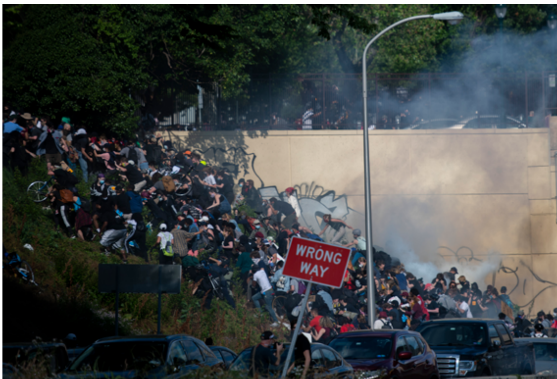
Manifestantes en Filadelfia corren cuesta arriba tras ser atacados con gas lacrimógeno.

Antes de decidir utilizar sustancias químicas irritantes hay que tener en cuenta siempre los factores contextuales, entre los que figuran la geografía del lugar de utilización, la temperatura, el viento y las condiciones meteorológicas, y también la presencia de hospitales, escuelas o lugares en las inmediaciones con mucha población ajena a la situación. 23