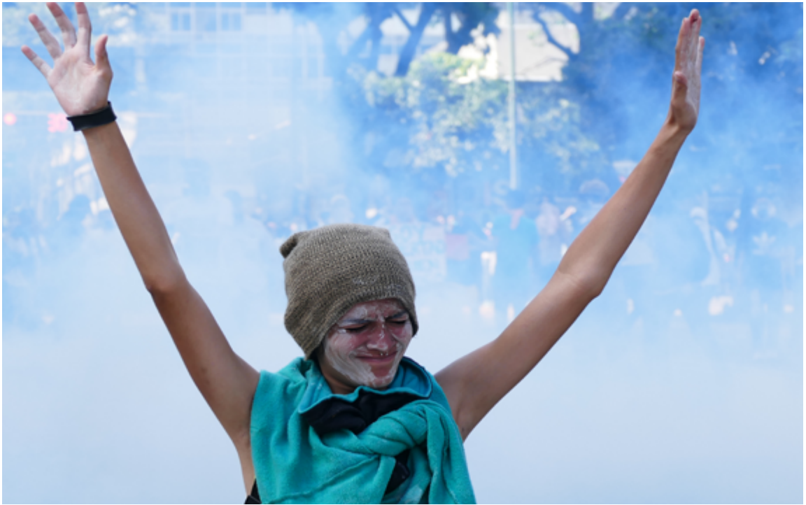
Manifestante pacífica expuesta a gases lacrimógenos en Venezuela.

y funcionarios encargados de hacer cumplir la ley deben procurar tomar medidas que afecten sólo a quienes participan en actos de violencia. Únicamente en caso de que la violencia esté tan generalizada que ello resulte ya imposible será admisible utilizar un tipo de arma de efecto indiscriminado. 14