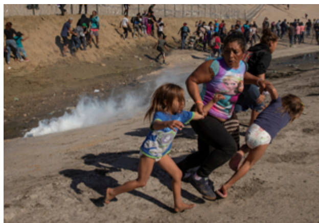
Una familia de migrantes huye del gas lacrimógeno frente al muro fronterizo entre Estados Unidos y México.

El gas lacrimógeno no afecta por igual a todo el mundo: los niños y niñas, las embarazadas y las personas de edad avanzada son especialmente sensibles a sus efectos. Los niveles de toxicidad varían en función de las especificaciones del producto, la cantidad empleada y el entorno donde se utilice. El contacto prolongado puede acarrear graves riesgos para la salud. El riesgo de lesiones físicas y en algunos casos de muerte (por ejemplo por asfixia) puede aumentar si las sustancias irritantes se utilizan junto con otro tipo de material, como esposas aplicadas a una persona ya inmovilizada, o si se usan contra personas que están bajo los efectos de drogas o alcohol.