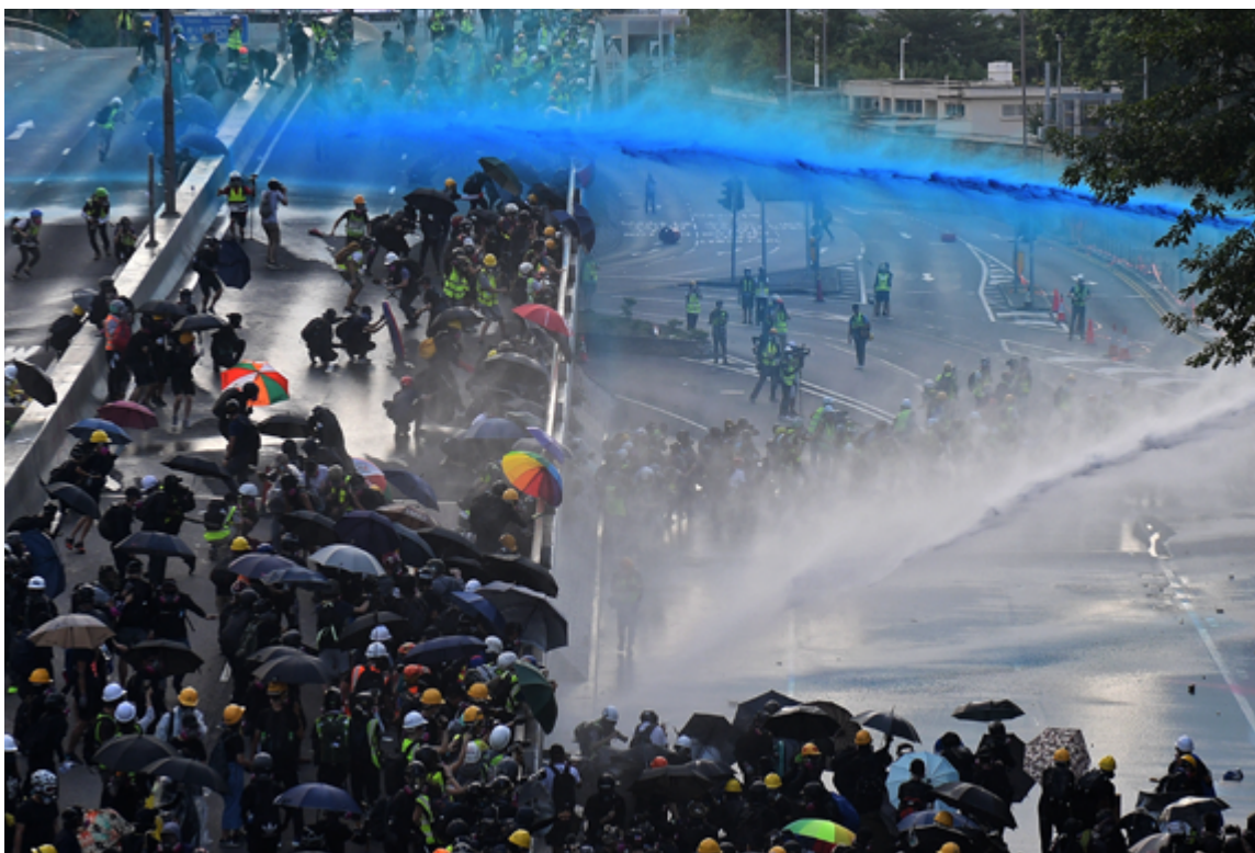
La policía dispara cañones de agua contra los manifestantes prodemocráticos ante la sede del gobierno en Hong Kong.

→ El uso combinado de sustancias químicas irritantes y dispositivos que presentan el riesgo de causar daños excesivos y tendrían fines operativos contradictorios debe prohibirse.