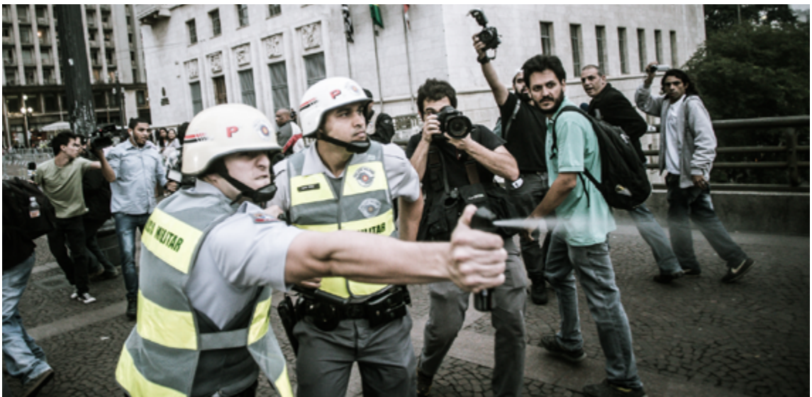
Un agente de la policía militar utiliza gas pimienta contra manifestantes en São Paulo.