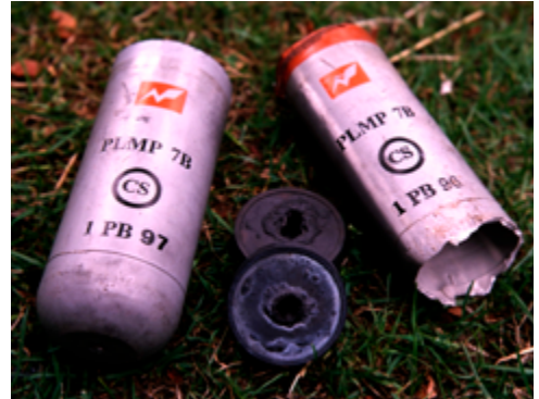
Marcas en botes de gas lacrimógeno fabricados en Francia que se utilizaron en junio de 1999 para disolver una manifestación en Nairobi, Kenia.