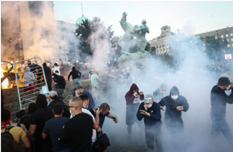
Uso de gas lacrimógeno durante las protestas contra el confinamiento por el coronavirus en Belgrado, Serbia.